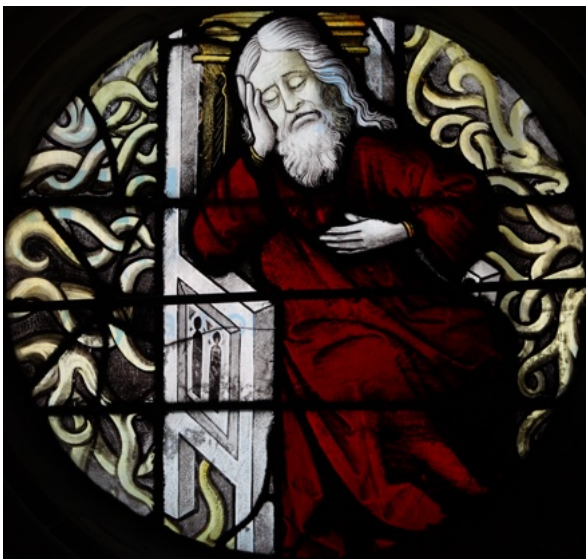
Oculus central : Jessé assis endormi.

du cardinal Guillaume d'Estouteville, abbé de Saint-Ouen de 1462 à sa mort en 1483. Il représente un Arbre de Jessé, c'est-à-dire la généalogie du Christ à partir du patriarche Jessé. Cette généalogie est fondée sur la prophétie d'Isaïe (11, 1-2) : “Un rameau sortira de la souche de Jessé, père de David, un rejeton jaillira de ses racines. Sur lui reposera l'esprit du Seigneur” et sur le début de l'évangile de saint Matthieu (1, 1-17) qui donne la généalogie du Christ, “fils de David, fils d'Abraham”.