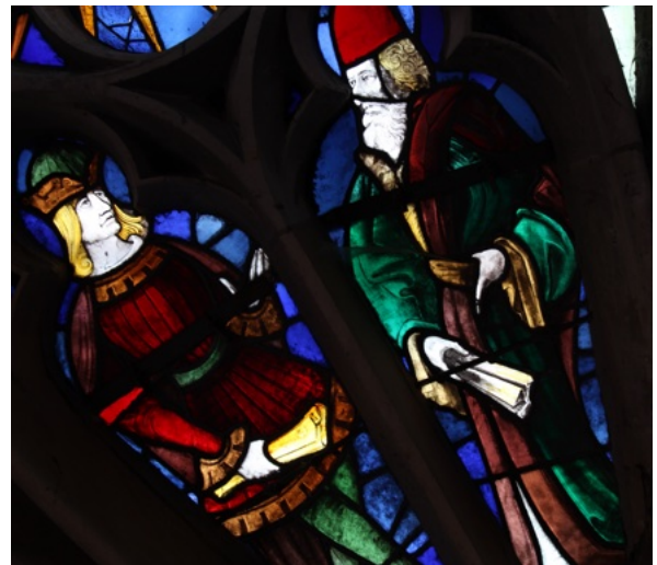
Deux des douze prophètes.

ce thème iconographique a été utilisé pour la première fois dans un vitrail. Jessé est couché et il dort. À Saint-Ouen, l'œuvre s'apparente aux arbres de Jessé des vitraux de Saint-Maclou (vers 1470) et de Saint-Godard (1506). Jessé endormi n'est pas couché mais il est assis sur un trône d'où part un enchevêtrement de branches ; la tête appuyée sur une main, il songe à sa glorieuse descendance qui conduit à la Vierge Marie et au Christ. La scène étant représentée sur la verrière d'une rose, ce qui est unique, le patriarche se trouve dans l'oculus central.