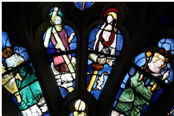
Le Christ et la Vierge Marie.

groupés deux par deux dans chaque pétale en forme d'amande du premier cercle ; ils tiennent un rouleau ou un livre dans la main. Trente-quatre rois de la tribu de Juda, ancêtres de Marie et de Joseph, les parents du Christ, sont représentés dans les pétales du second cercle. Portant sceptres et couronnes, ils apparaissent en buste dans les corolles de grandes fleurs dont les tiges partent de Jessé. Au sommet, à droite du roi David qui joue de la harpe, le Christ portant sa Croix se tient debout à côté de sa mère, la Vierge Marie.