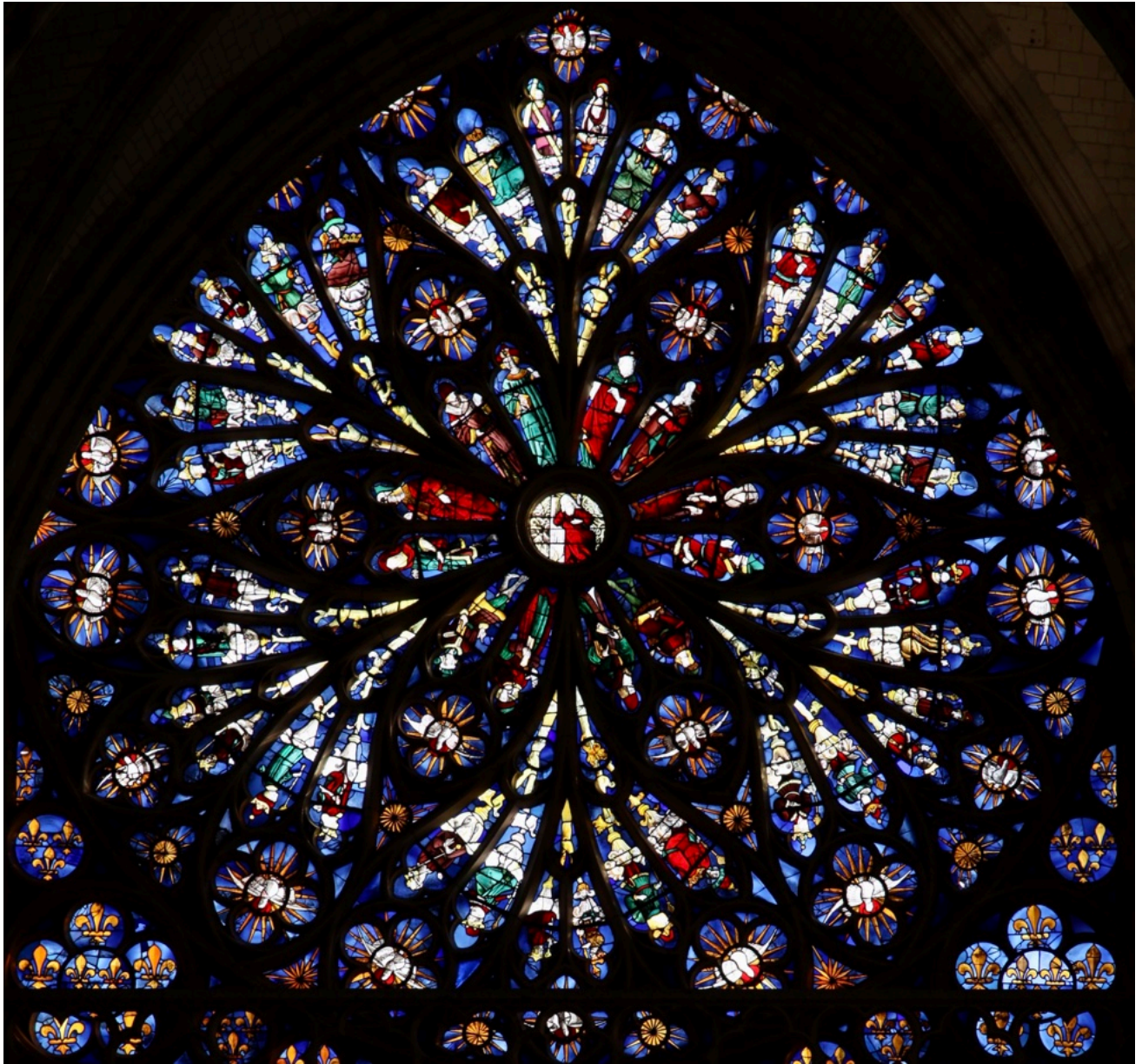
L'arbre de Jessé à l'Abbatiale St-Ouen de Rouen.